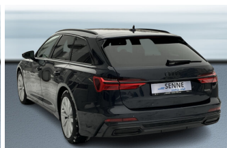
SENNE Audi A8