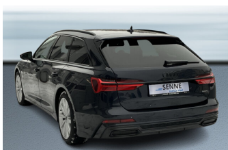
SENNE Audi A8