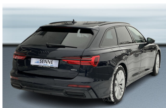
SENNE Audi A8