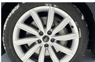
SENNE Audi A8