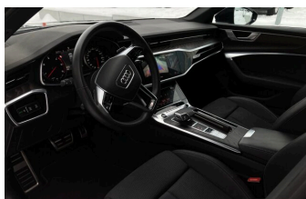
SENNE Audi A8