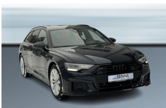
SENNE Audi A8