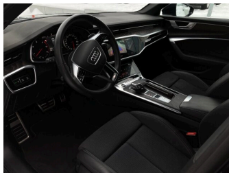
SENNE Audi A8