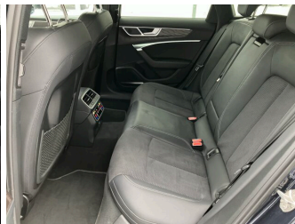
SENNE Audi A8