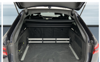
SENNE Audi A8