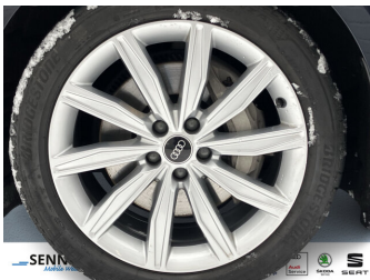
SENNE Audi A8