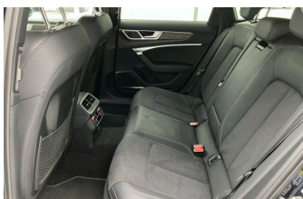
SENNE Audi A8